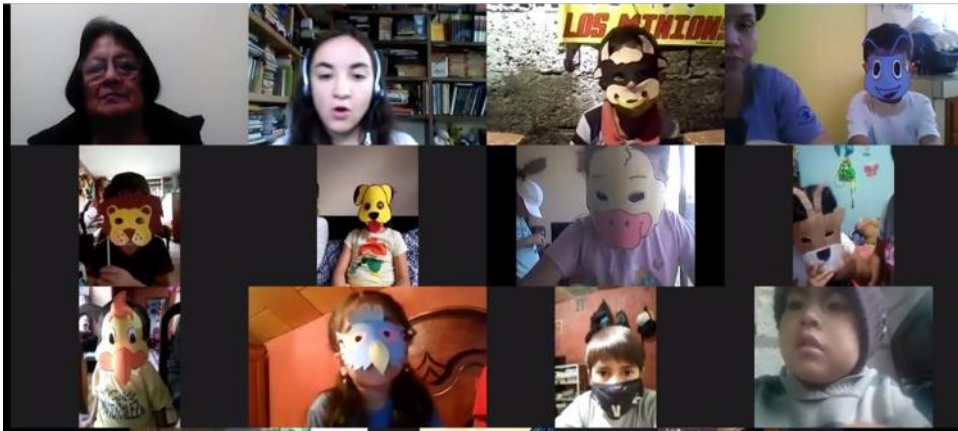
Representando el cuento