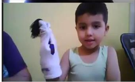
Realizando los títeres en casa