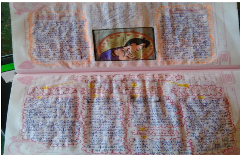
Cuaderno de una estudiante