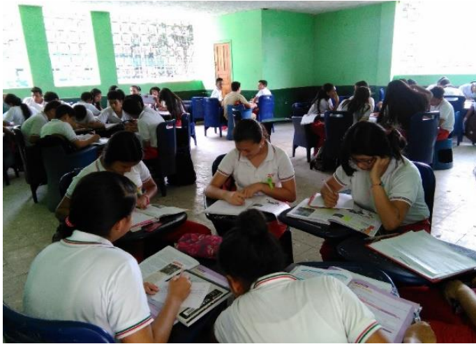
Trabajando en grupo