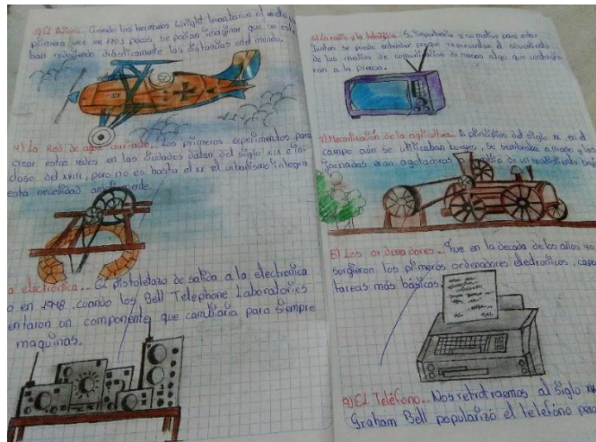
Consulta sobre los inventos del siglo XX