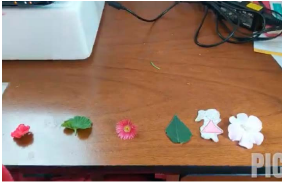
Figura 5. Animación 2 digital realizada durante el taller