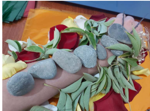
Figura 2. Exploración de la relación cuerpo-entorno natural realizada durante el taller