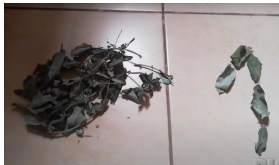
Figura 4. Stop motion 1 realizado durante el taller

El taller incitó una aproximación a la competencia digital y la facilidad para crear juegos y producciones multimediales. Se fundamentó en la pedagogía reggiana, según la cual el niño aprende a través del asombro y el descubrimiento. Para el tema paisajes digitales se empleó el programa Pic Pac, que se podía descargar de forma libre y gratuita en el celular, aplicación que crea la ilusión de movimiento a elementos estáticos sean estos moldeables o no, además de insertar audio o música, es decir, la técnica de animación Stop Motion. Se utilizó esta herramienta para lograr el objetivo de consolidarlo en un video animado. Se consideró oportuno que las herramientas tecnológicas del taller, en este caso el celular, sean comunes al entorno familiar porque, lo explicó Tabares (2019), los niños aprenden más cuando su aprendizaje está mediado por objetos que forman parte de su cotidianidad.