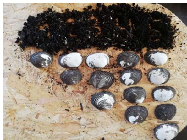
Figura 3. Ejercicio de nociones básicas de cantidad realizado durante el taller

Se aportó de manera interdisciplinar en concordancia con los contenidos, objetivos y destrezas del Currículo para desarrollar las nociones básicas y la confluencia de las operaciones lógicas sustanciales, vistas claramente en el taller mediante la coordinación del trabajo en conjunto con la matemática, las estrategias artísticas y la tecnología.