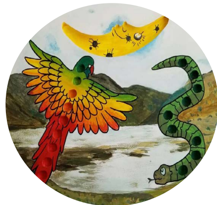
Figura 1. Uña taptana en material concreto creado por el proyecto UNAE-ICPIE-001

El recurso parte de lo que señala D’Ambrosio (2013) sobre la enseñanza de la matemática: que no puede ser hermética ni elitista, debe tener en cuenta la realidad socio-cultural del niño, el ambiente en el que vive y el conocimiento que trae de casa, dado que en las comunidades muchos cuentan con semillas y piedras. Por tanto, es fundamental para los docentes de educación inicial una enseñanza contextualizada a partir de un conocimiento oriundo de los cañaris por medio de la leyenda de los cañaris y el significado de la leoquina y la guacamaya para establecer el proceso del contar en los niños. De este modo, como indicaron Bishop (1999) y Bonilla et al. (2018), se invita a crear una nueva concepción de las matemáticas y se demuestra su relación con la cultura de los estudiantes.