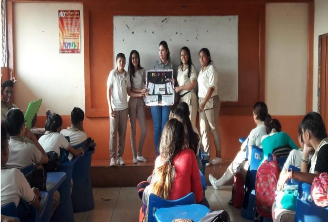
Exhibiendo el informativo realizado a través del trabajo colaborativo, referente a los temas Alemania Nazi y el Fascismo