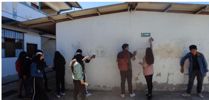
Lijado de la pared

Nota. En esta fotografía se observa cómo los estudiantes preparan el espacio de intervención mural.