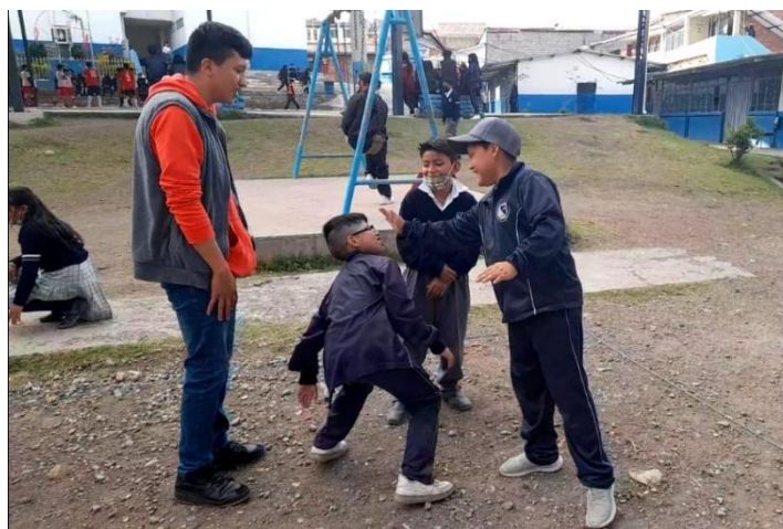
Estudiantes participando en el juego hipnotismo colombiano.