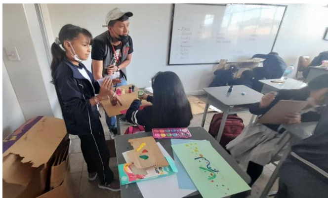
Estudiantes creando los elementos para el escenario y vestuario.