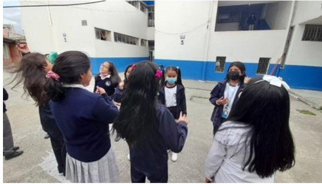
Estudiantes realizando ejercicios y juegos de improvisación teatral