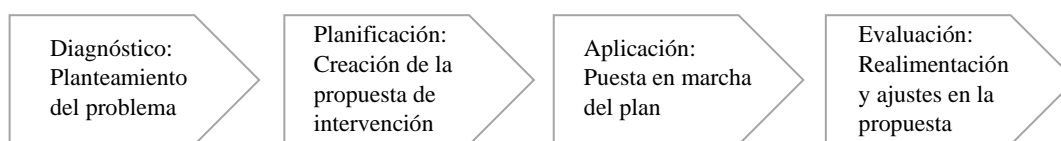
Figura 1 Fases de la Investigación-acción