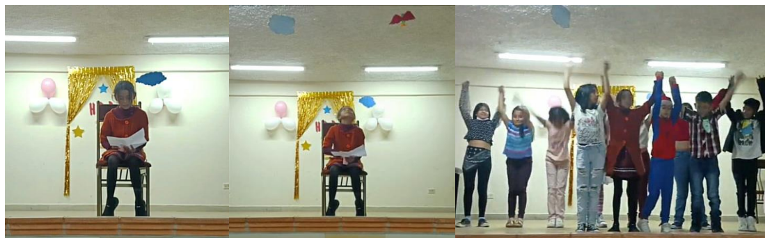
Tabla 16 Análisis Acto III

La tercera escena fue interpretada por un personaje y transcurrió en el patio de la abuela Catalina, mientras la misma tomaba un café y leía el periódico. De pronto sintió caer unas semillas en su cabello y levantó su cabeza, a lo lejos pudo ver a un ave que se asemejaba a Freedom entonces escuchó su particular canto y supo que era él quien volaba cerca. Después de unos segundos sacó la foto que Sara le había tomado al momento de liberarlo, la miró y en ella brotó una gran sonrisa. Fin.