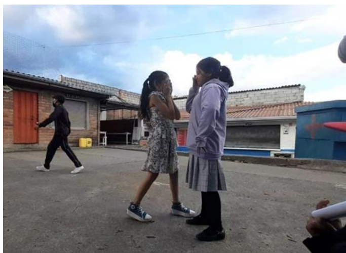
Estudiantes interpretando una escena sobre la amistad y la tristeza