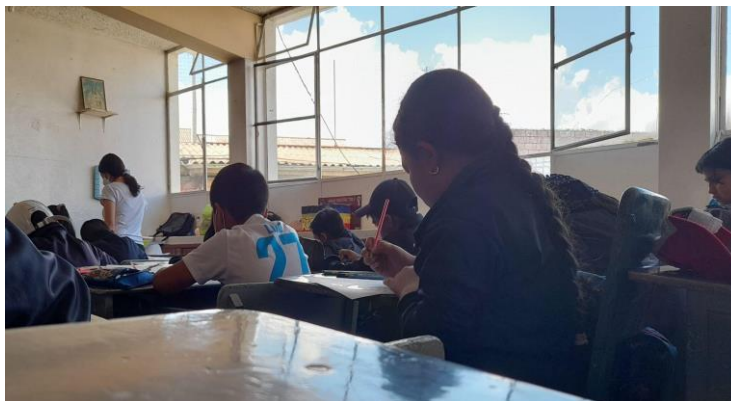
Estudiantes creando el diseño de vestuario y escenario.