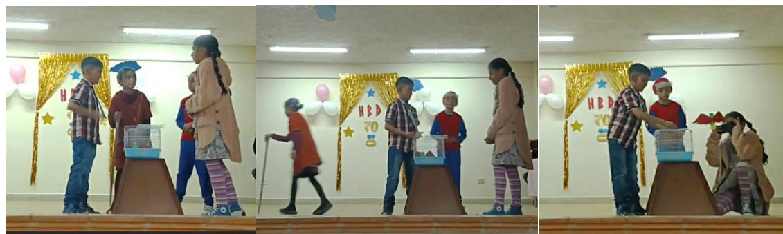
Tabla 15 Análisis Acto II