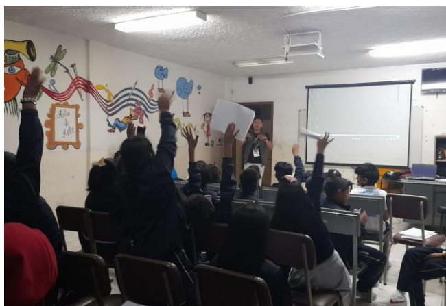
Figura 4 Socialización del tema

Estudiantes durante la ronda de preguntas sobre la investigación realizada.