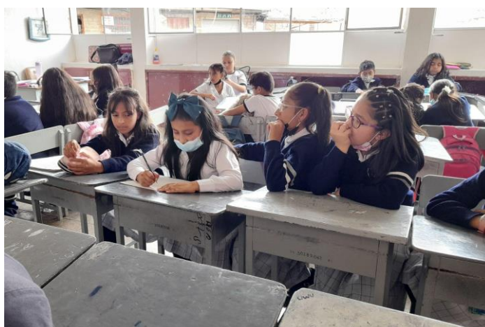
Figura 6 Cadáver exquisito

Estudiantes reunidos realizaron la actividad cadáver exquisito.