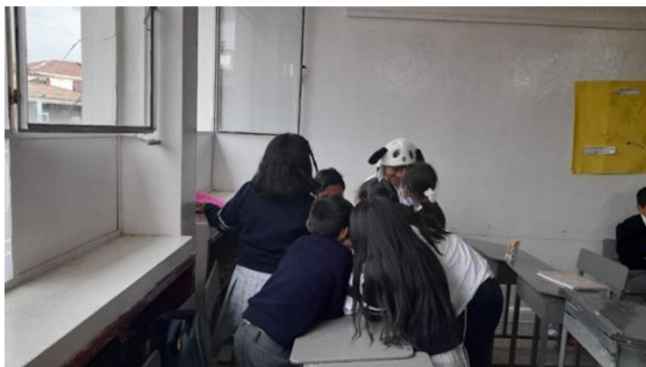
Estudiantes reunidos conversando para elegir una respuesta