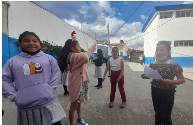
Estudiantes interpretando la obra teatral “Freedom” en ensayos en el patio de la institución.