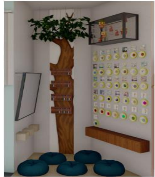
Rincón 2: el ABC de la interacción.