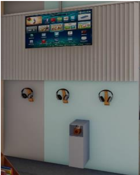
Rincón 3: en línea check.