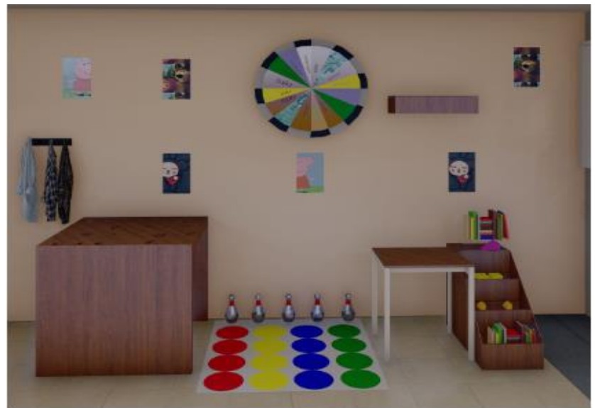
Rincón 4: la dinámica del amor.