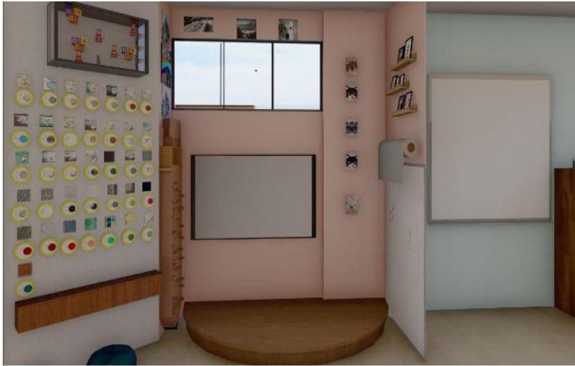
Rincón 1: compartiendo magia.