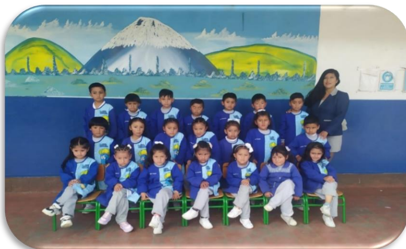
Imagen 1 Foto docente con los infantes