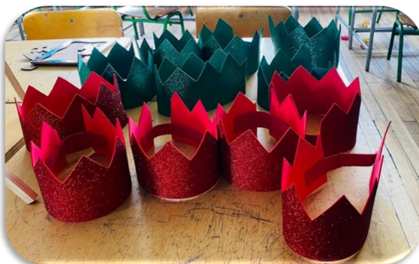
Imagen 3 Coronas para los rincones