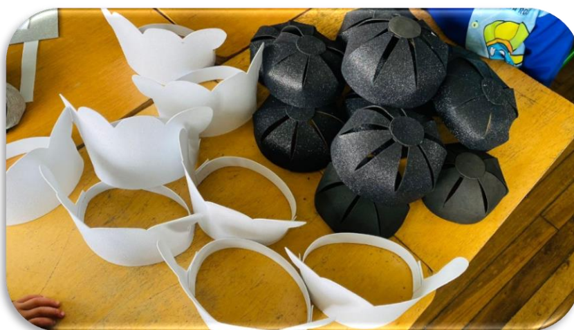
Imagen 2 Gorros de chef y pintores