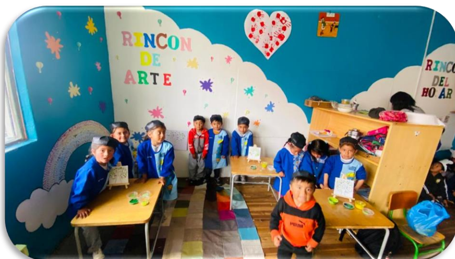
Imagen 5 Infantes en el Rincón del Arte