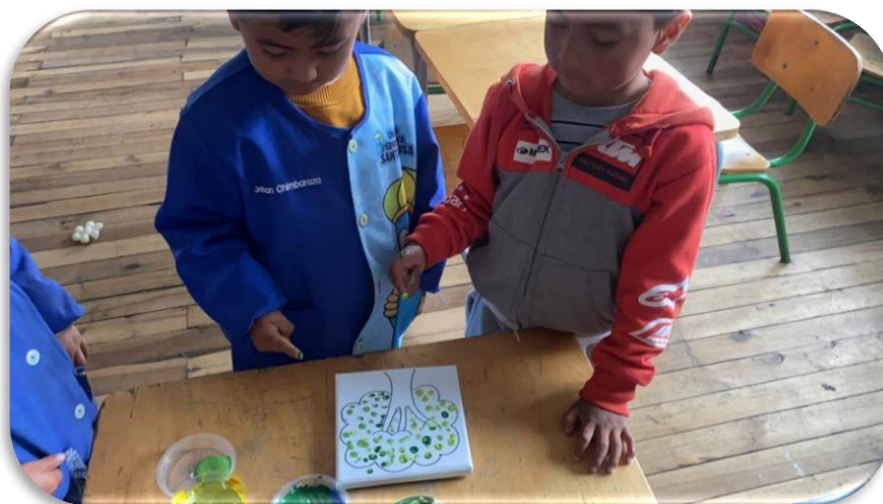
Imagen 9 Infantes pintan con huellas un árbol