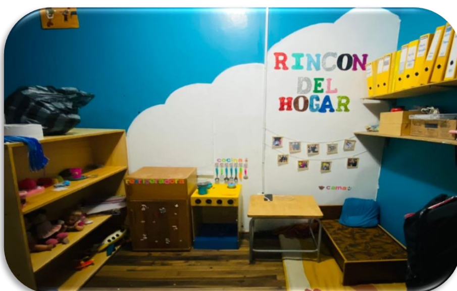
Imagen 6 Implementación del Rincón del Hogar