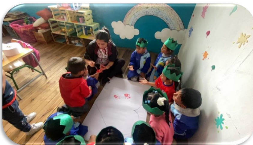
Imagen 8 Dejando huellas