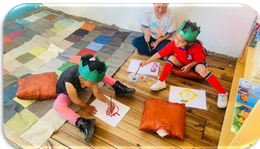
Imagen 7 Actividad dibujo a mi compañero