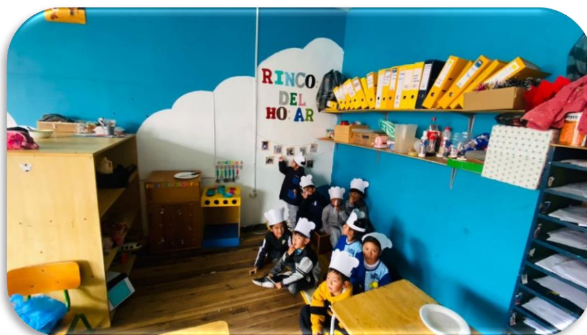
Imagen 4 Infantes en el Rincón del Hogar