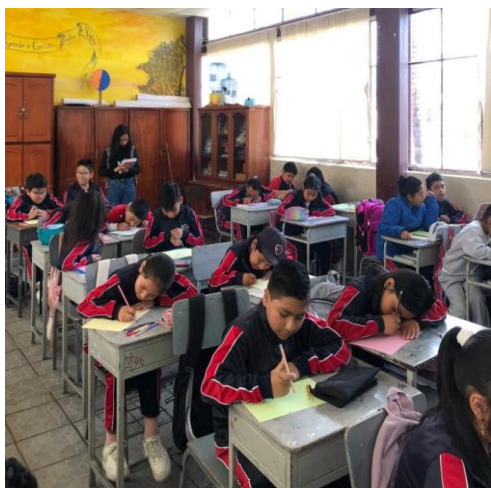
Actividad del cuento Cañari