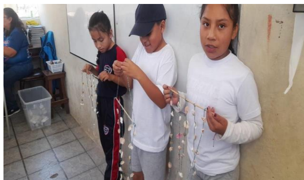
Campanadas de viento