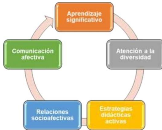
Figura 1. Criterios de análisis desde la operacionalización de las categorías.

Quaranta, (2019), plantea que la escucha empática (...), es “la cooperación, entendiendo por esto el interés de participar, la confianza de presentar una idea contrapuesta, el poder expresar creencias, valores, pensamientos, sentimientos (...)”. (p.32).