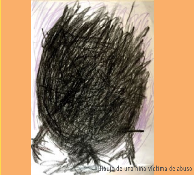
Dibujo de una niña víctima de abuso

con centenares de entrevistas, investigaciones y audiencias que al pasar los días no dan resultados, sino más bien, siguen abriendo múltiples heridas ocasionadas y reviviendo actos de inmundicia originados por enfermos mentales (El Comercio, 2017).