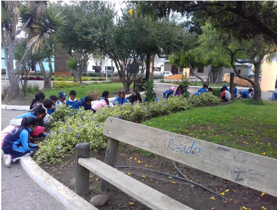
Fotografía 3: Exposición de trabajos grupales