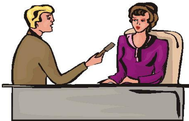
Ilustración: leyendo la entrevista

En esta Secuencia Didáctica trataremos aspectos de carácter periodístico, conoceremos cómo se planifica y se realizan algunas entrevistas, lo que nos permitirá poner en práctica los conocimientos adquiridos, para lo cual se presentan nuevas ideas de trabajo con los estudiantes dentro del aula, y poder alcanzar así los fines deseados con los siguientes pasos: