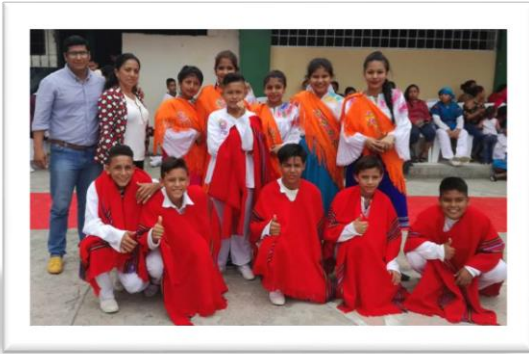
En la presentación del inti raymi.