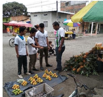
Visita de los estudiantes al mercado de víveres.

A través de todos estos indicadores se pudo evidenciar que los estudiantes han incrementado el conocimiento de las diferentes culturas y que al final de la unidad son capaces de hacer cómo el saber observar la hora mediante la Chacana andina, también depende los resultado esta situados de acuerdo al nivel de enseñanza que el docente ha impartido y es donde el resultado del aprendizaje tiene una correlación directa con las estrategias la cual indican la claridad de los aprendizajes.