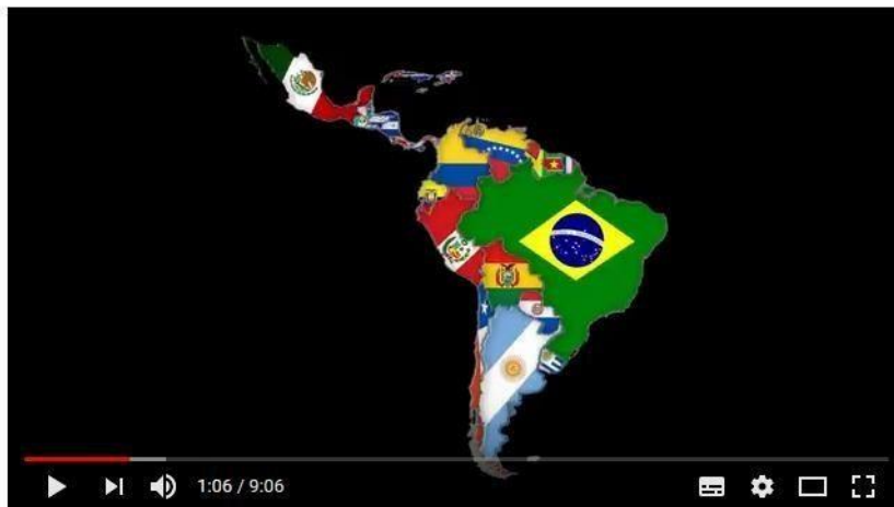
La psicología del mestizaje en Ecuador y Latinoamérica

Dirección web: https://www.youtube.com/watch?v=5laiSi3WOpE&t=150s