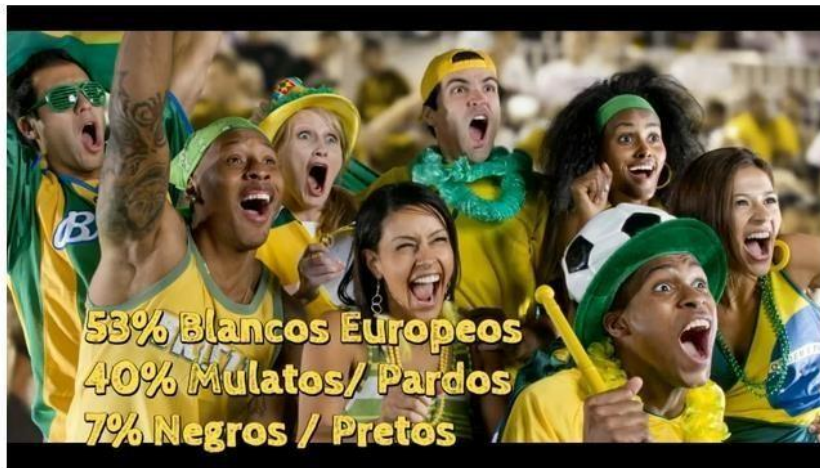
Composición Étnica de Latinoamérica

Dirección web: https://www.youtube.com/watch?v=nyGNuAPSnM4&t=136s