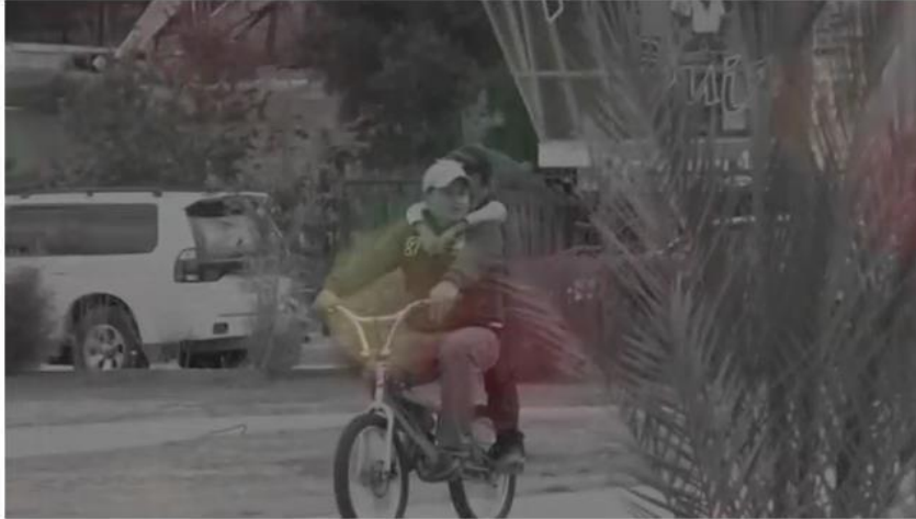
El Fenómeno Migratorio en el Ecuador | La migración