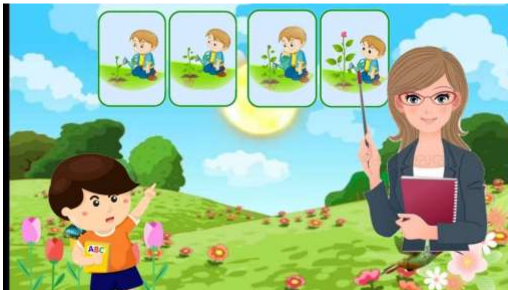
Ilustración 18 Fórmemos oraciones