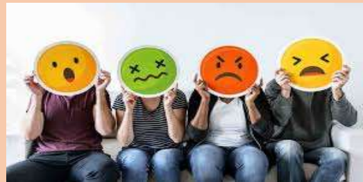
Ilustración 6 Las emociones