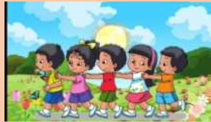
Ilustración 17 Manos al frente