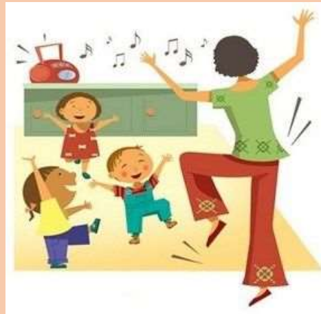
Ilustración 3 Expresión Corporal