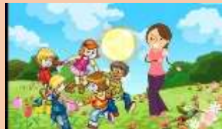
Ilustración 15 Tingo tango