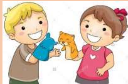
Ilustración 8 Jugando con títeres