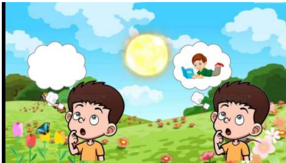
Ilustración 14 El mundo de la imaginación