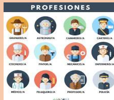
Ilustración 2 Las profesiones