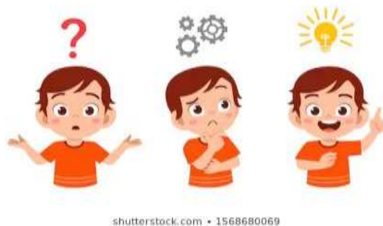
Ilustración 4 Niño pensando