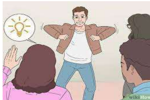
Ilustración 1 Jóvenes moviéndose.