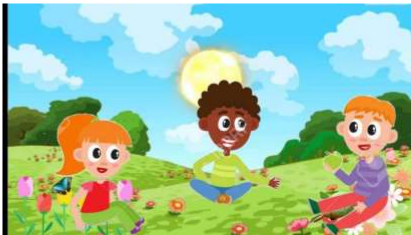
Ilustración 16 A tomar distancia