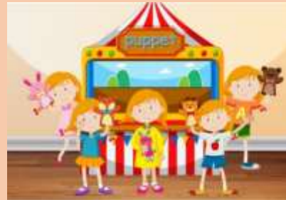
Ilustración 9 Función de títeres