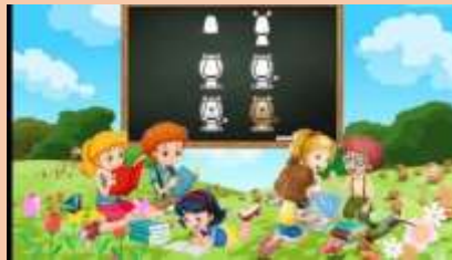
Ilustración 19 Inventemos