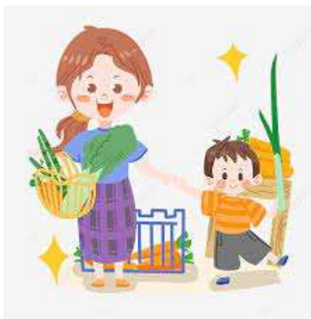
Ilustración 10 El mercado