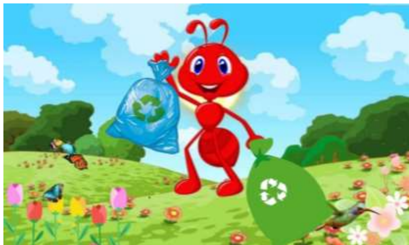
Ilustración 12 Hormiga CHUA