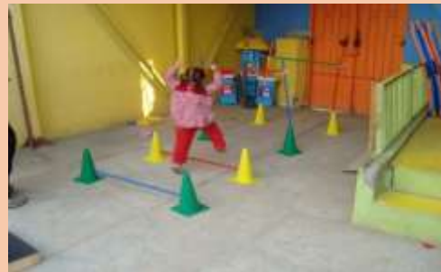
Ilustración 5 Niña pasando obstáculos