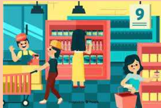
Ilustración 11 Personajes del mercado

Nota: Recuperado de: https://www.freepik.es/vector-gratis/gente-comprando-supermercado-ilustracion-personajes_4450849.htm por Freepik, 2018.