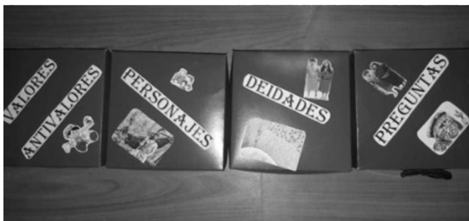
Figura 3. Cajas del saber