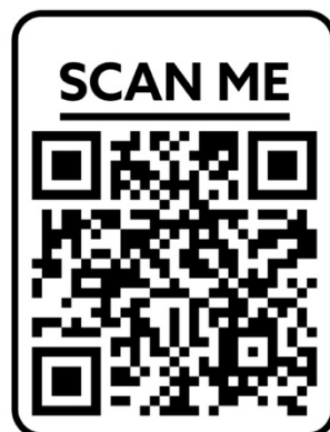
Figura 1. Ejercicio de arte postal creado por R2, propuesta código QR

había heredada: “...el arte, para mí, es una forma de expresión que la he llevado en mi mente, en mi corazón, en mi cuerpo, siempre, desde que nací, porque la mayoría en mi familia son [sic] artistas. Está plasmado en mi ser (Comunicación personal, 22 de noviembre de 2020).