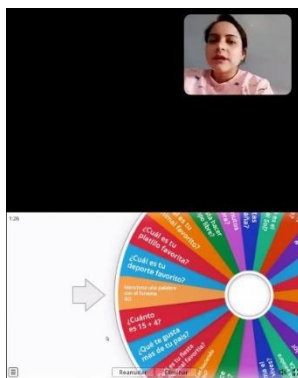
Figura 3. Evidencia: Actividad 1

Descripción: Se inició la sesión con un saludo cordial hacia la docente, los padres de familia y los estudiantes, posterior a ello, se les presento una serie de diapositivas dando a conocer el nombre de la actividad, su objetivo, su descripción, su implementación y el recurso digital. Por otro se procedió a tomar lista para constatar que todos los estudiantes estén presentes, es así que al comenzar se dividió a los estudiantes en salas de dos personas y se les brindo la ruleta con las preguntas. Caber recalcar, que el recurso digital presento preguntas con enfoque académico, personal, social, entre otras; además de ello, el recurso contenía música entretenida y armónica, colores brillantes e imágenes para propiciar un ambiente dinámico y acogedor.