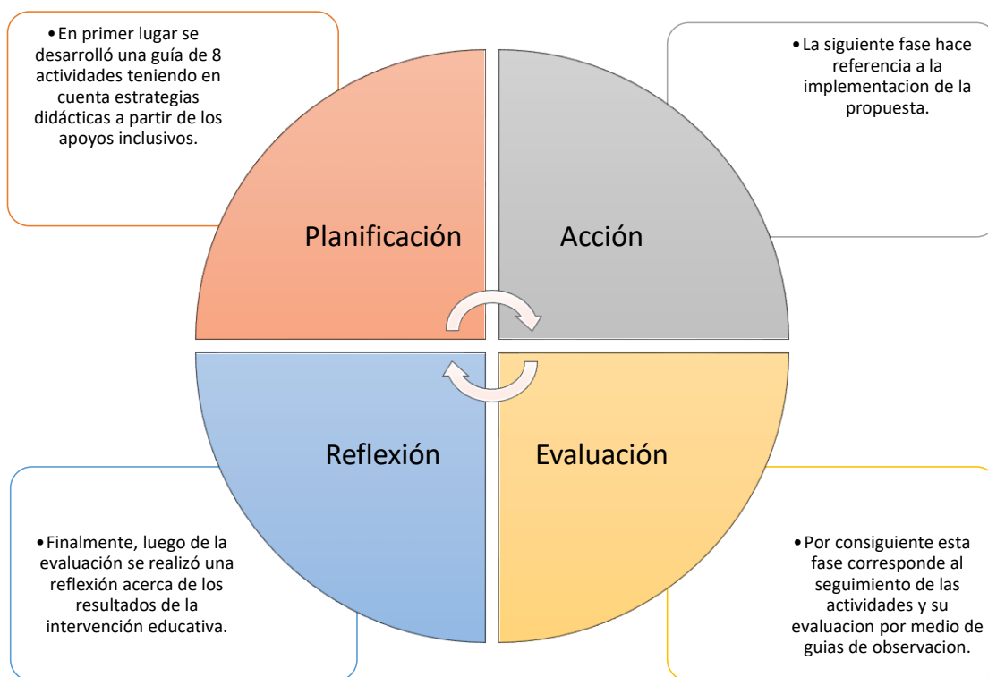
Figura 1. Facetas de la propuesta

Para desarrollar y estructurar la propuesta didáctica se ha tomado en cuenta el modelo Kemmis, el cual, se basa en cuatro momentos esenciales de la propuesta siendo la planificación, acción, evaluación y reflexión dimensiones en constante interacción (Camarillo & Minor, 2018). Por consiguiente, dichas fases se detallarán a continuación en la siguiente figura: