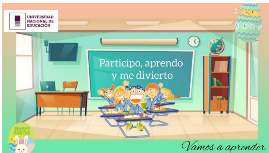
Figura 2. Logo de la propuesta "Participo, Aprendo y me divierto"