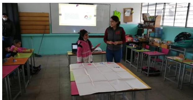
Figura 6. Evidencia: Actividad 4

Descripción: La siguiente sesión se llevó a cabo en la presencialidad, en primer lugar, se procedió con un saludo cordial hacia la docente, los padres de familia y los estudiantes, posterior a ello, se les presentó una serie de diapositivas dando a conocer el nombre de la actividad, su objetivo, su descripción, su implementación, los materiales y los recursos digitales. Acto seguido, se colocó un paleógrafo de gran tamaño en el centro y se brindó a los estudiantes acuarelas para que pasen y coloquen su huella y escriban su profesión favorita, en voz alta y junto al grupo los estudiantes interpretaron su profesión y el resto de la clase debía adivinarla. En el momento de la actividad hubo música de fondo y se les brindó varios colores creando un proceso dinámico y divertido. Finalmente, se brindó una reflexión sobre la actividad.