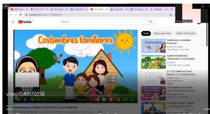
Figura 4. Evidencia: Actividad 2

una costumbre familiar? ¿Realizan alguna de ellas con sus papitos? etc. Por otro lado, se les indicó a los estudiantes realizar grupos de 4 personas dando uso a la estrategia del trabajo cooperativo en donde con ayuda de los padres de familia dialogaron acerca de que costumbres familiares que realizan con su familia y si son similares y dibujar su costumbre favorita. Para terminar, se explicó a los estudiantes que a pesar de tener costumbres familiares diferentes muchas de ellas son muy parecidas.