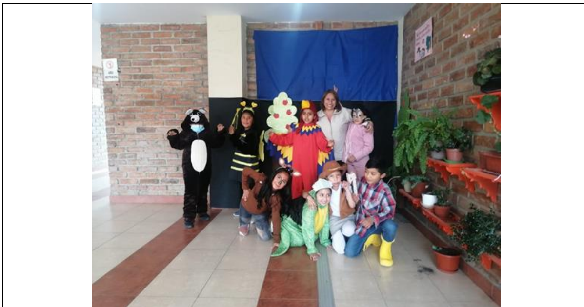
Ilustración 5 Trabajo con disfraces