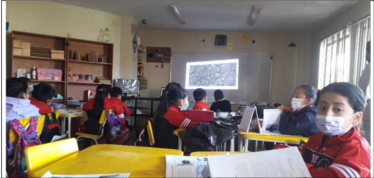
Ilustración 3 Trabajo en clases