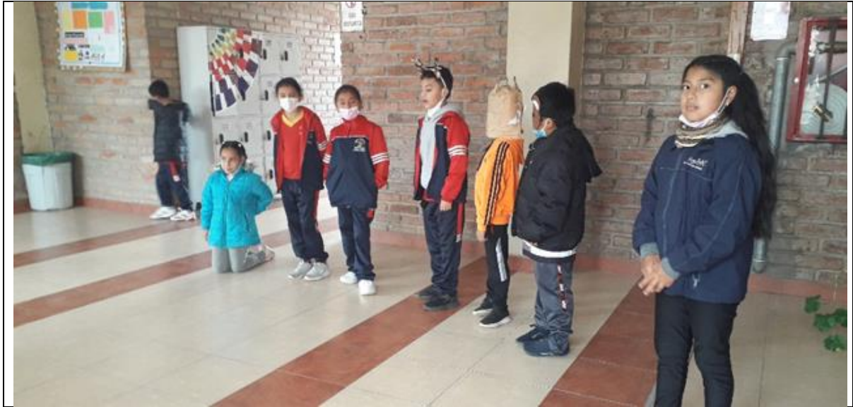
Ilustración 4 Trabajo en los pasillos