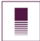
Tabla 9 Ficha de Participantes