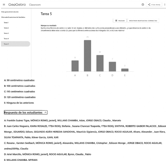
Figura 2. La barra de estado del progreso de los estudiantes

El dispositivo ofrece una visión general de todas las tareas o de algunas de ellas al profesor. La visión general de la puesta en marcha ofrece en tiempo real de lo que están haciendo los participantes. La vista general de las tareas ofrece al profesor una guía del progreso general de la clase a través de una barra de estado que se actualiza a medida que los estudiantes introducen las tareas. La vista general de las tareas orienta al profesor sobre el progreso general de la clase a través de una barra de estado que se actualiza a medida que los alumnos introducen las tareas (De Sá Reis y Dos Santos, 2022).