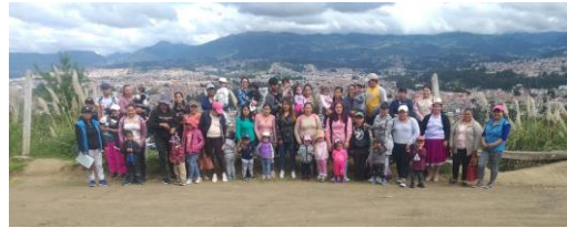
Anexo fotográfico 6