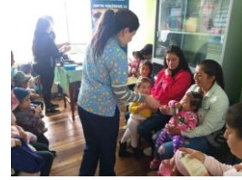
Anexo fotográfico 4