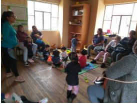
Anexo fotográfico 3