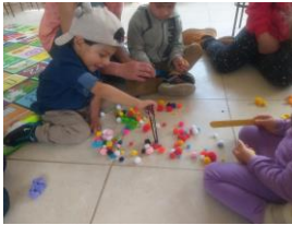
Anexo fotográfico 5