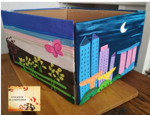
Caja del silencio