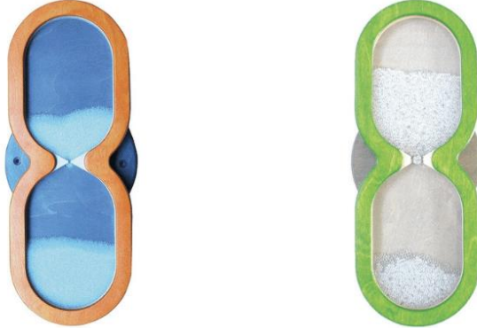
Reloj de arena visual sensorial