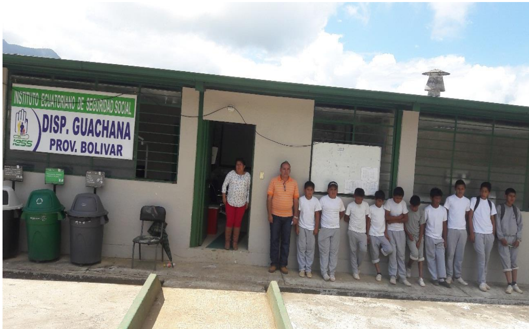
ALUMNOS VISITANDO EL DISPENSARIO MÉDICO