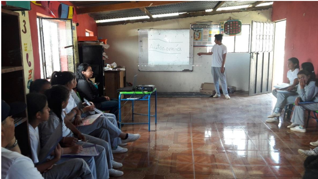
ESTUDIANTE EXPONIENDO EL TRABAJO DEL GRUPO