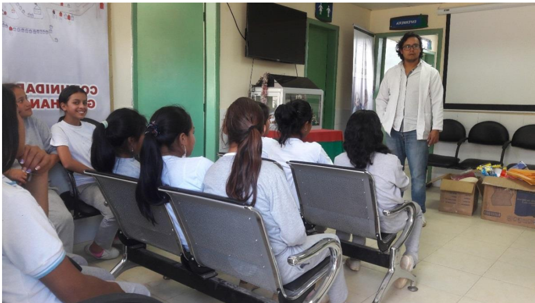
ALUMNOS ESCUCHANDO A REPRESENTANTE DE LA UNIVERSIDAD