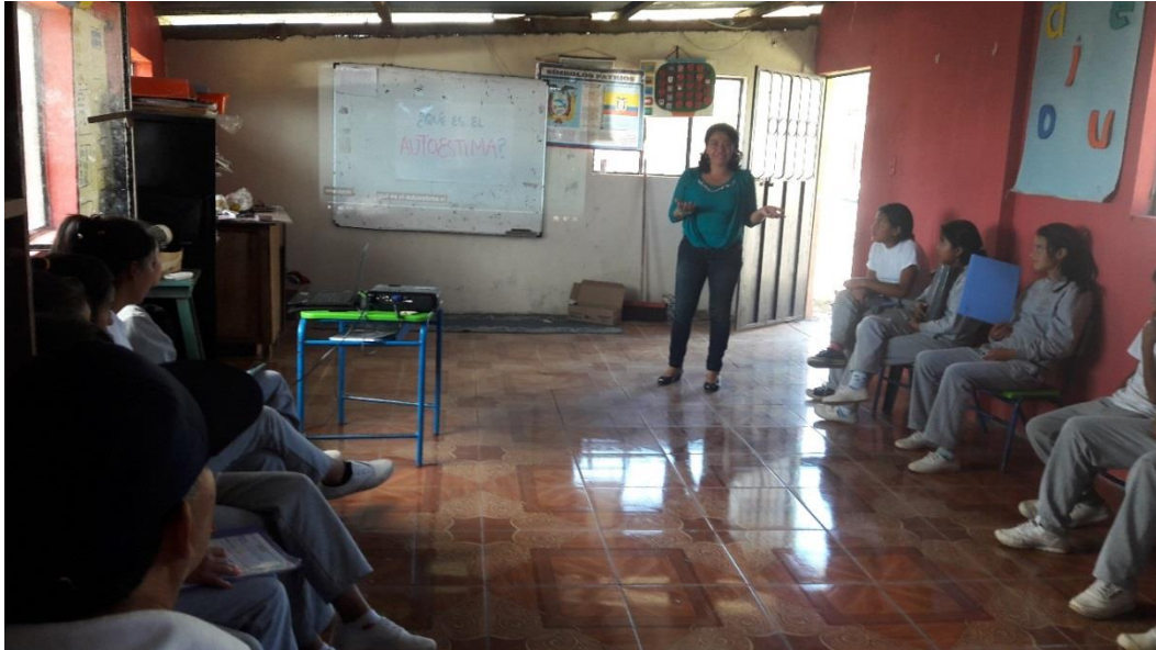
DOCENTE REALIZANDO LA INTRODUCCIÓN DE LA TEMÁTICA