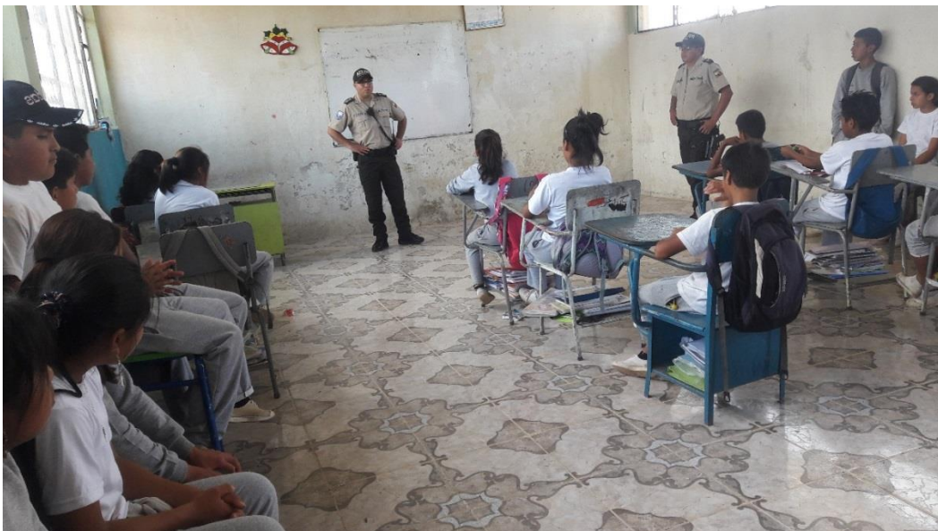
ALUMNOS ESCUCHANDO LA INFORMACIÓN DE LA POLICÍA