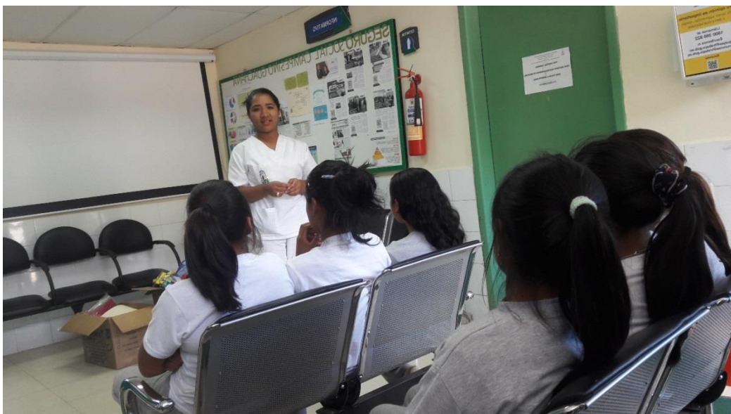
ALUMNOS RECIBIENDO INFORMACIÓN DE ENFERMERÍA