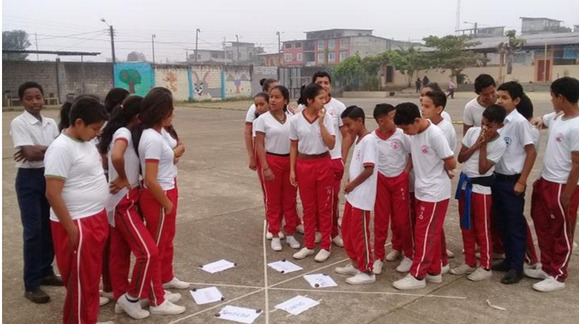
Expresando sus emociones (Actividad 4)