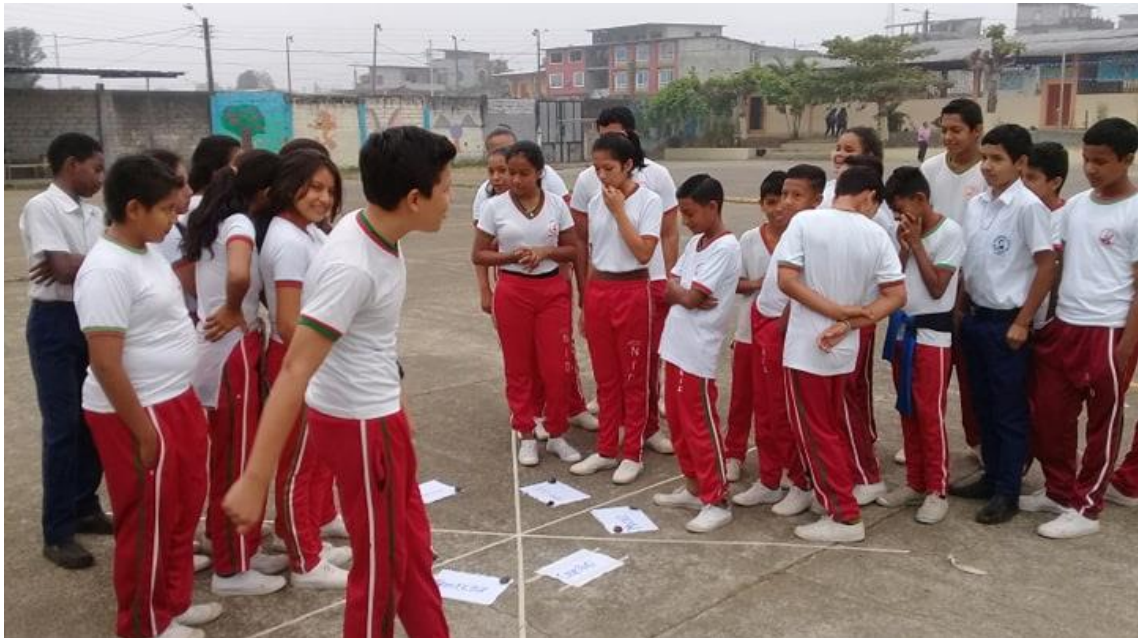
Expresando sus emociones (Actividad 4)