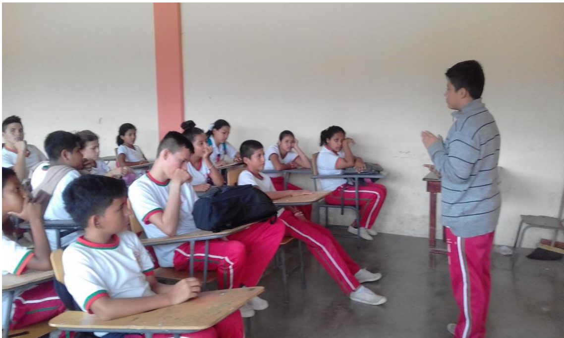
Así prestan atención a sus compañeros ahora: Act. N° 3