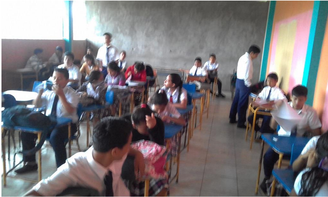
Así eran al principio, un poco conflictivos. (Entrevista)