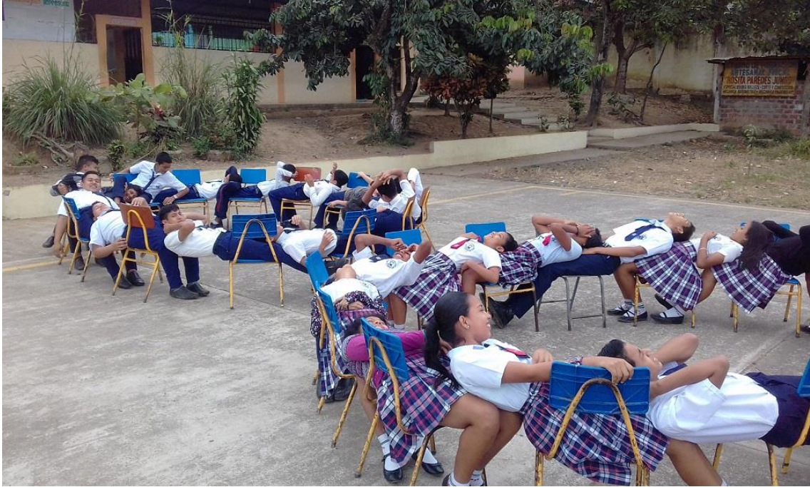
Trabajando en equipo (Actividad N° 5)