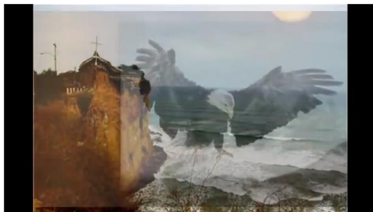
El vuelo del águila y el valor del tiempo..wmv