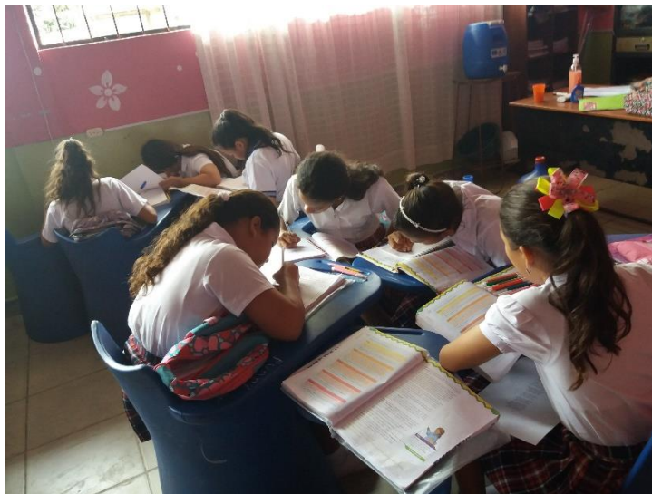
Trabajo grupal para la elaboración de metáforas