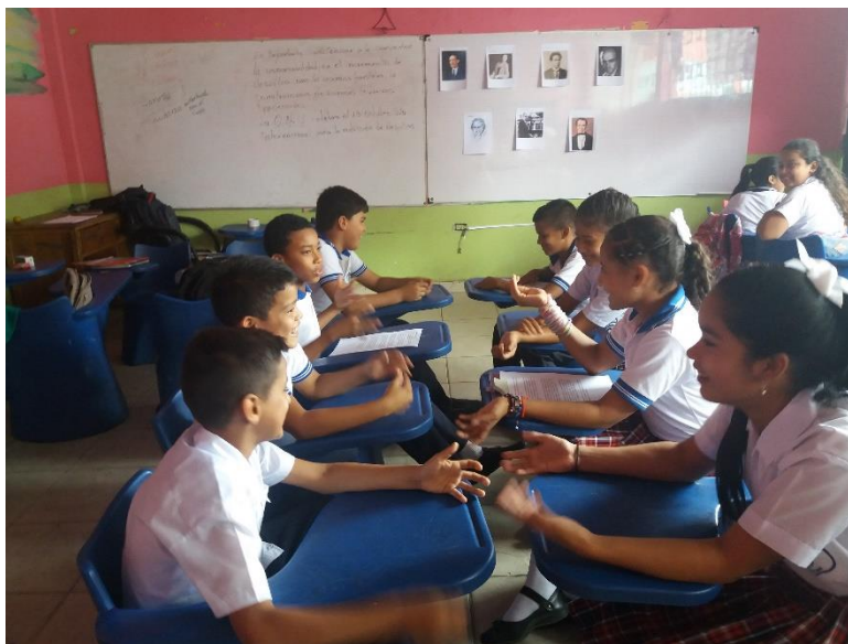
Debate sobre la poetas clásicos y la actuales