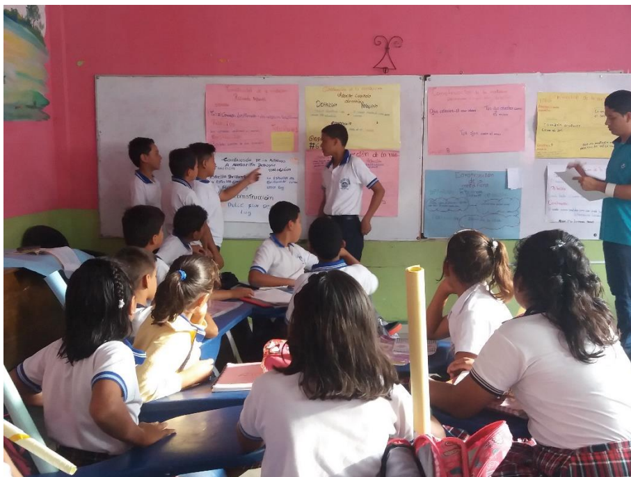
Aplicación de rúbricas en exposición