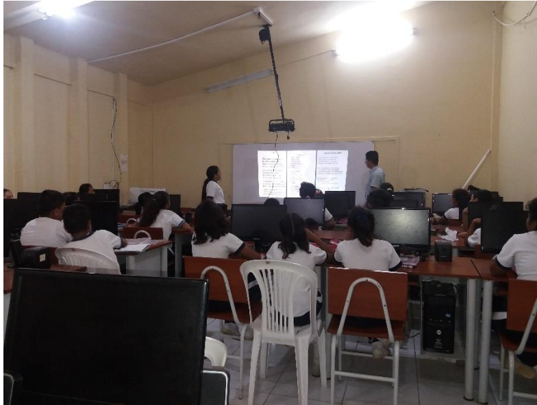
Lectura de poesías