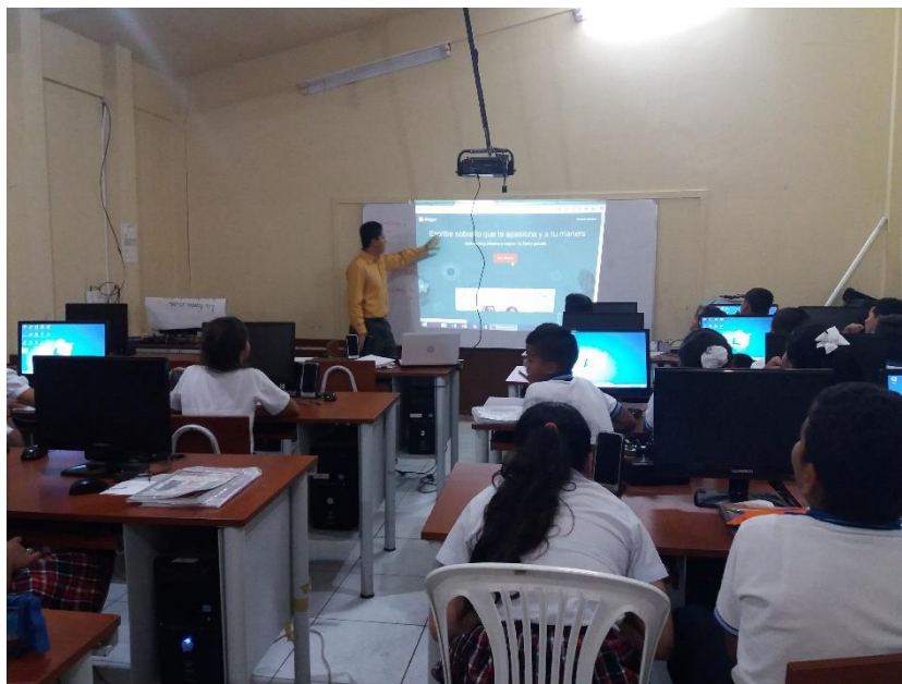
Creación del blog