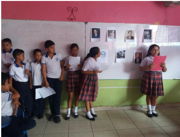
Lectura de poesías de autores ecuatorianos