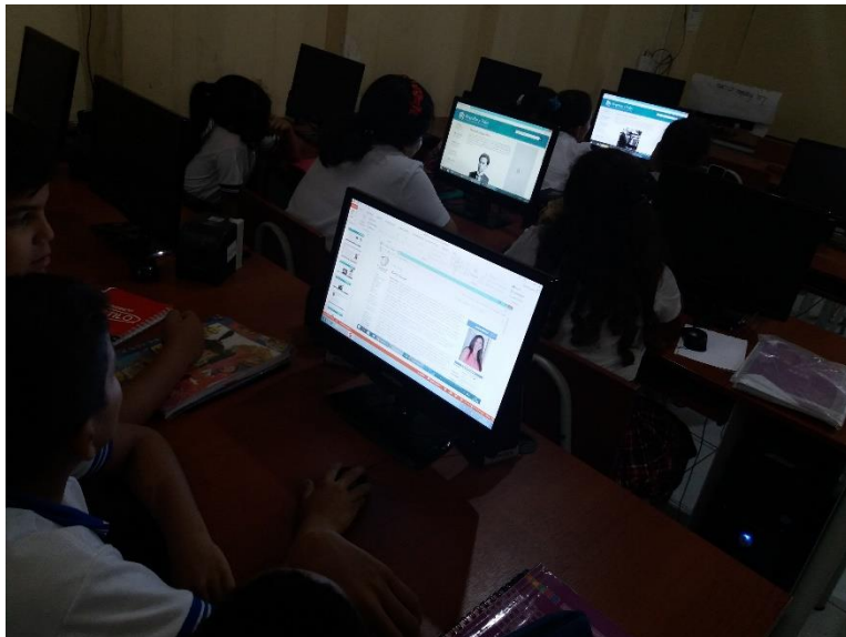
Investigación sobre autores de poesía ecuatoriana