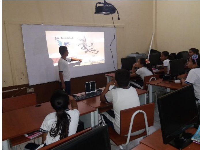
Interpretación de metáforas gráficas