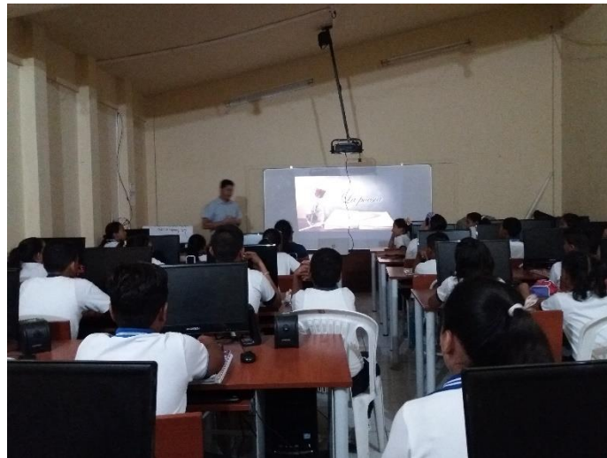
Explicación de la poesía