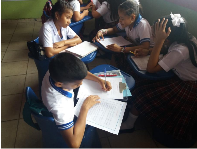
Creación de poesías propias