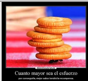
Imagen No. 12. Cuanto mayor sea el esfuerzo http://img.desmotivaciones.es/201206/HardWorkAnt.jpg