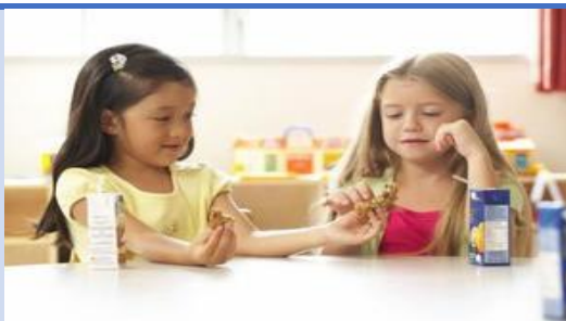
Imagen No. 7. ¿Cómo enseñar a los niños a compartir?

http://www.cyberdiggs.com/upload/d/69/d699b1831c2e1811cc155d98ac82f58b.jpg