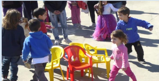
Imagen No. 10. Juegos de la silla.

https://i.ytimg.com/vi/f_Z798G03SA/maxresdefault.jpg