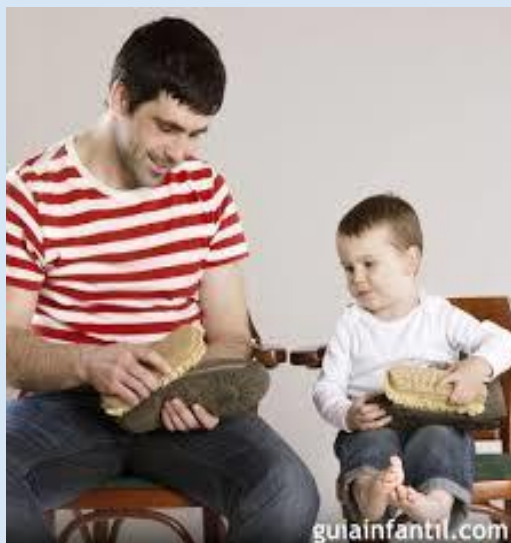
Imagen No. 4. Nuestro ejemplo es la mejor enseñanza

https://static.guiainfantil.com/pictures/blog/2570-nuestro-ejemplo-es-la-mejor-ensenanza-para-los-ninos.jpg