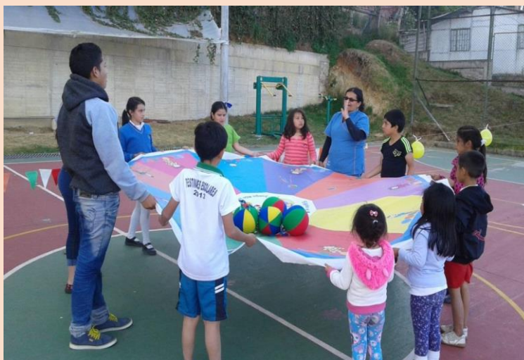
Imagen No. 9. Actividades de trabajo

http://www.sopo-cundinamarca.gov.co/NuestraAlcaldia/SaladePrensa/PublishingImages/pr--aactivimerce.jpg