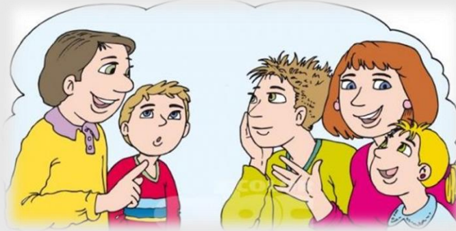
Imagen No. 5. La falta de diálogo aleja a los padres

https://s3-sa-east-1.amazonaws.com/assets.abc.com.py/2012/03/21/la-falta-de-dialogo-aleja-a-los-padres-de-los-hijos-310820_595_298_1.jpg