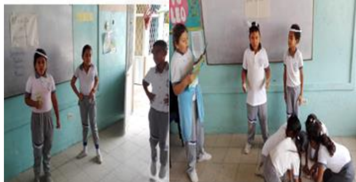
Dramatizando cuentos clásicos