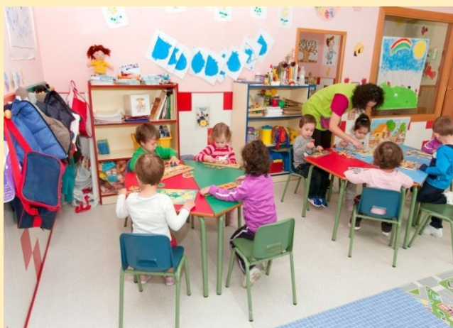
Imagen No. 6. Consejos para promover el respeto

http://www.panorama.com.ve/___export/1485813831774/sites/panorama/img/pitoquito/2017/01/30/dsc_4403.jpg_1828552786.jpg