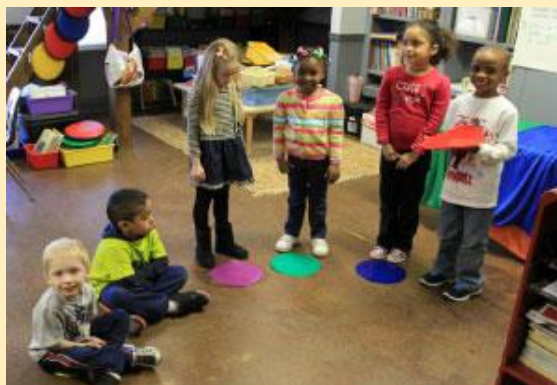
Imagen No. 11. Espacio personal. Estrategias para enseñar empatía.