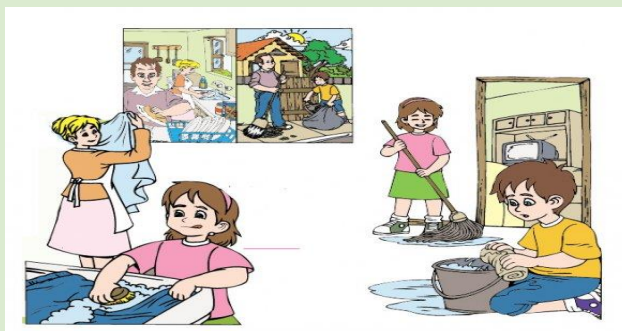
Imagen No. 3. Para una convivencia pacífica

https://s3-sa-east-1.amazonaws.com/assets.abc.com.py/2012/03/21/para-una-convivencia-pacifica-272287_587_464_1.jpg