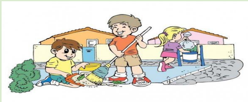
Imagen No. 8. Salud, escuela y medio ambiente.

https://s3-sa-east-1.amazonaws.com/assets.abc.com.py/2012/04/09/_595_352_7140.jpg