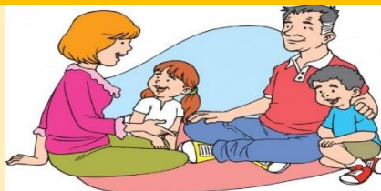
Imagen No. 1. Rol de la familia

https://s3-sa-east-1.amazonaws.com/assets.abc.com.py/2015/06/22/_820_573_1245963.jpg