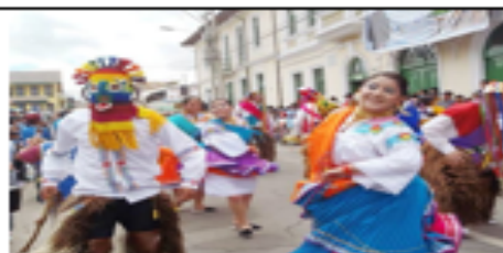
Personajes de la cultura popular cayambeña