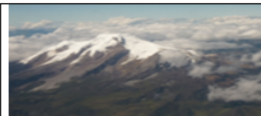
Majestuoso Volcán Cayambe