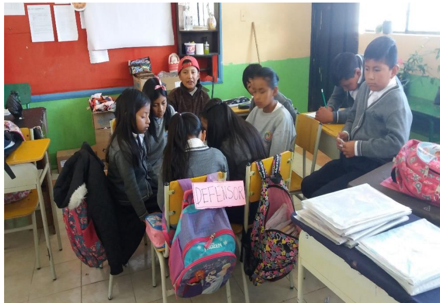
Fotografía. 3. Defensores