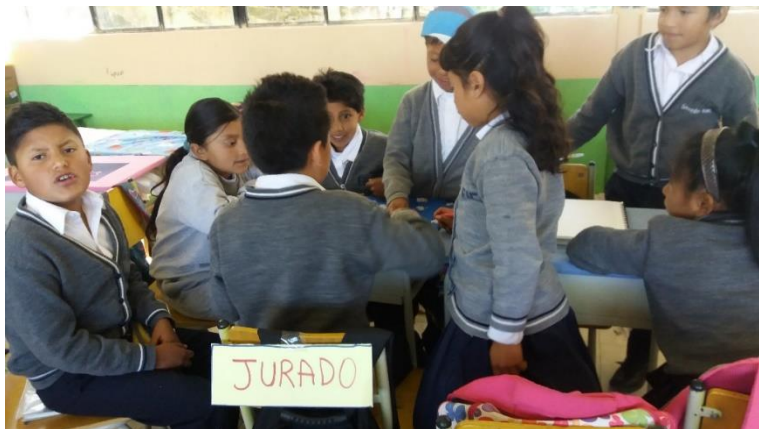
Fotografía. 1. Jurado