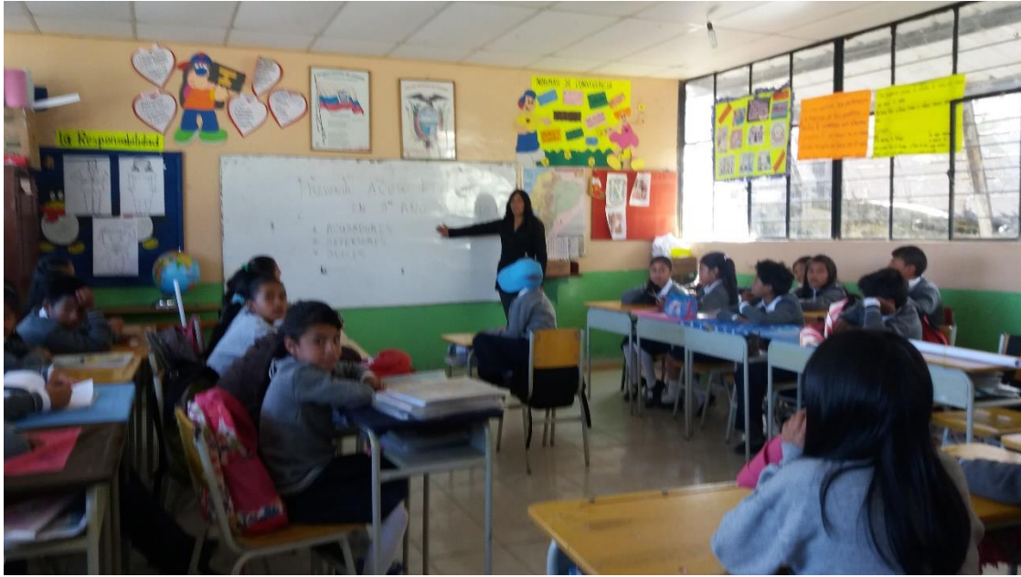
Fotografía. 4. Explicación del trabajo en equipo