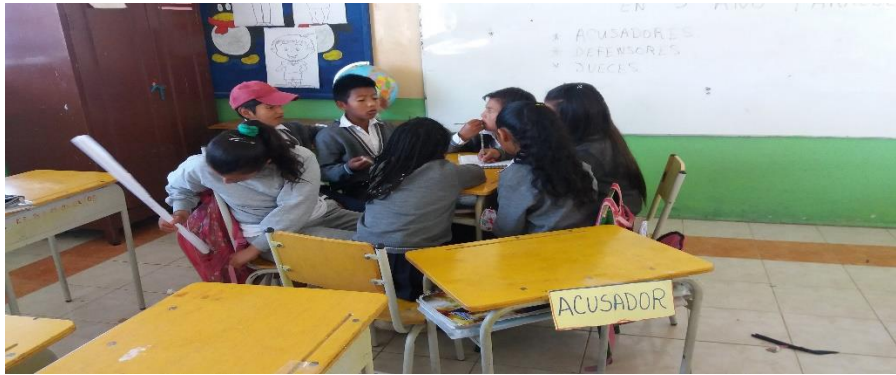
Fotografía. 2. Acusador